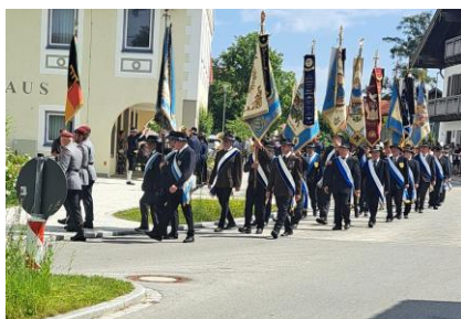
Einmarsch der Fahnenabordnungen

Erstmals wurde in diesem Jahr für uns aktive Soldaten/innen, Reservisten/innen und Veteranen/innen am 15. Juni ein jährlicher Ehrentag in Form eines Veteranentages eingeführt. Am 15. Juni 2025 konnten wir dann erstmals bei strahlendem Sonnenschein und großer Hitze auf dem Marienplatz der Heimatgemeinde vom Mutterhaus der deutschen Fallschirmjäger, der Luftlande- und Lufttransportschule (LL-LTS) in Altenstadt diesen besonderen Tag feiern.