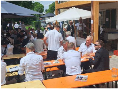
Abschließend gut besuchte Kameradschaftsfeier mit familiärem Charakter

kommunalen Gemeindevertretern der umliegenden Nachbardörfer entsprechend gewürdigt.