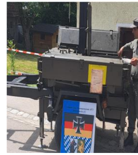
Alte Gulaschkanone der NVA Soldaten & Veteranen Hohenfurch