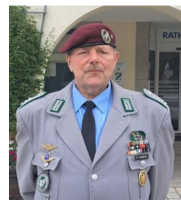
Präsident EMFV am Marienplatz

Leider haben so manche, auch ehemalige große Standorte der Bundeswehr auf eine Würdigung ihrer Soldaten verzichtet. Aus Nah und Fern reisten die Besucher an - und auch eine Abordnung von verwehrten Einsatzveteranen nahm teil, die unter großem Beifall begrüßt wurde. Alle Soldaten, sowie der Dienst aller Soldaten wurde durch ein hohes Engagement von Bürgern, Politikern,