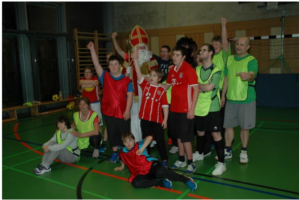
Besuch der behinderten Fußballkinder