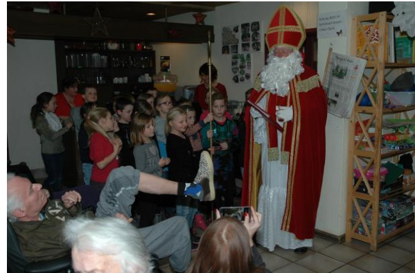
Besuch im Seniorenheim St.Lukas

An dieser Stelle darf ich die Neujahrsgrüße des Kdr AusbStP LL-LTrsp, Herrn OberstLt Schoebel weitergeben.