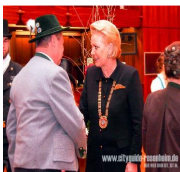
Oberbürgermeisterin Gabi Bauer