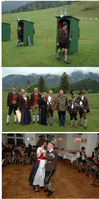
Der Schützenwalzer für den Schützenkönig