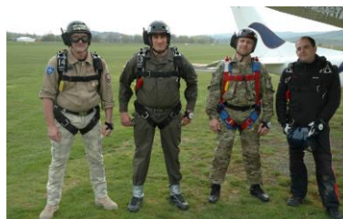
Fertig zum Sprung