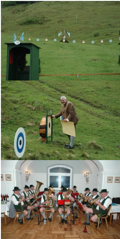
Eine bayerische Blaskapelle spielte kräftig auf