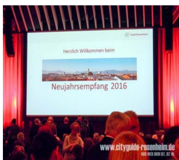
Kur- und Kongresszentrum In Rosenheim