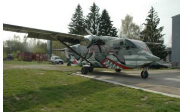
Skyvan SC 7