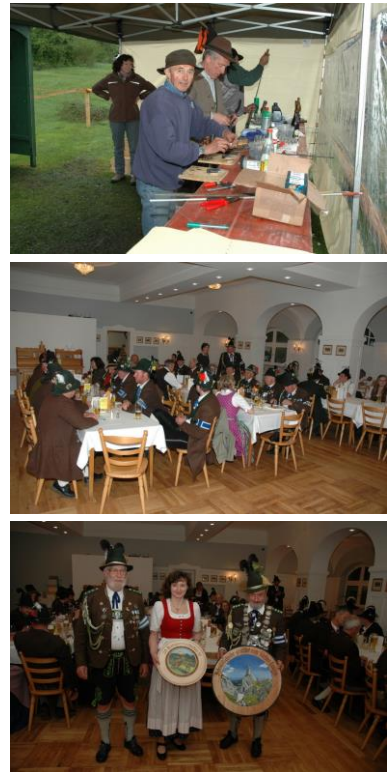
Schützenkönig Waldemar mit der Gewinnerin der Damenklasse und Hauptmann Toni Egger

Ein weiteres „Highlight“ im 1.Halbjahr bot sich dem EMFV mit der Durchführung eines weiteren Zielfernrohrkurses. So traf man sich unter bewährter Leitung unseres EMFV Kameraden Oberfeldwebel der Reserve Helmut Schulte vom 20. bis 22.Mai 2016 zum sportlichen Zielfernrohrschießen auf Distanzen von 100 bis 200m.