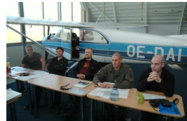
Wieder einmal die Schulbank drücken