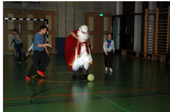
Besuch der behinderten Fussballkinder, Adi mischt kräftig am Ball mit