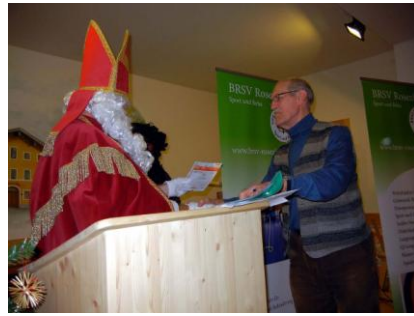
Sportabzeichenverleihung beim Behinderten- und Rehabilitations Sportverein Rosenheim e.V.