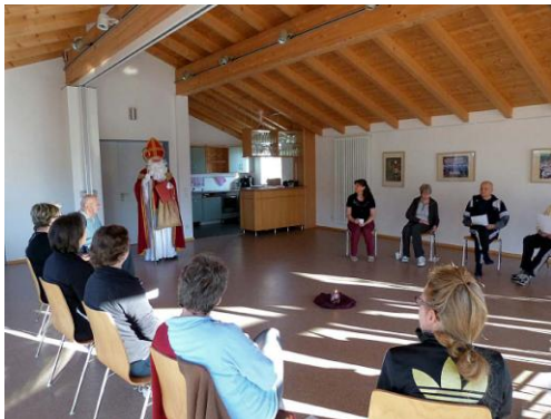
Besuch der Krebs-Reha-Sportgruppe nach einer Krebserkrankung

Wieder einmal war der EMFV Nikolaus in Person von "Adi" ehrenamtlich für wohltätige Zwecke rund um Rosenheim unterwegs. Besucht wurden Behinderteneinrichtungen, Seniorenheime, behinderte Fußballkinder, Schwerstbehinderte und arme Kinder von Flüchtlingsfamilien, die sich alle über die kleinen Gaben freuten. So konnte der EMFV heuer wieder aus den eingegangenen Spenden und aus den Verleihungen unserer St.Michaelsmedaille über 2.100,00 EURO für wohltätige Zwecke spenden. Vielen Dank an alle Spender, die besonders den behinderten Fussballkindern und mittellosen älteren Menschen in den Seniorenheimen und mittellosen Kindern eine kleine weihnachtliche Freude ermöglichten. Der EMFV Nikolaus ist bei diesen Menschen in der Weihnachtszeit sehr gern gesehen und eine schöne Abwechslung im tristen Alltagsleben.