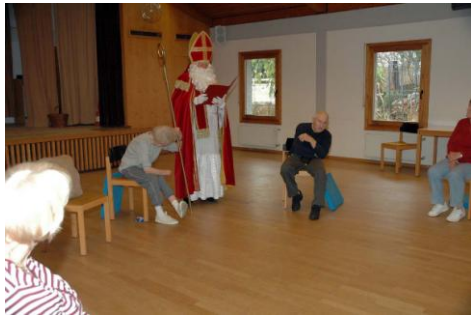
Besuch der Parkinson Reha-Sportgruppe